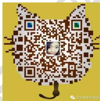
首席数据官联盟秘书处