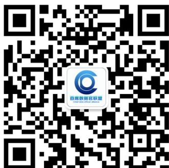
首席数据官联盟公众号